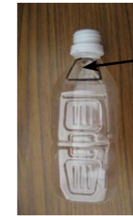
水抜き穴をあける